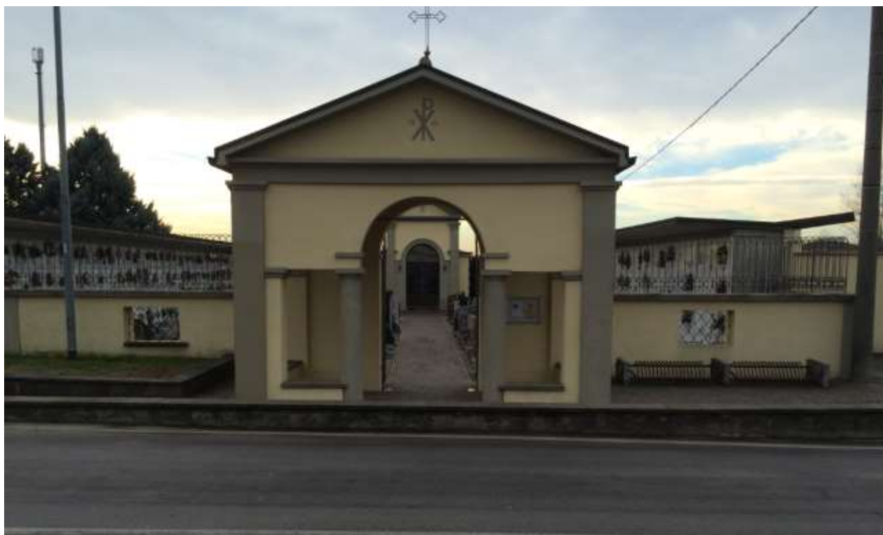
fig.1 – Vista dell'ingresso pedonale da Via De Gasperi