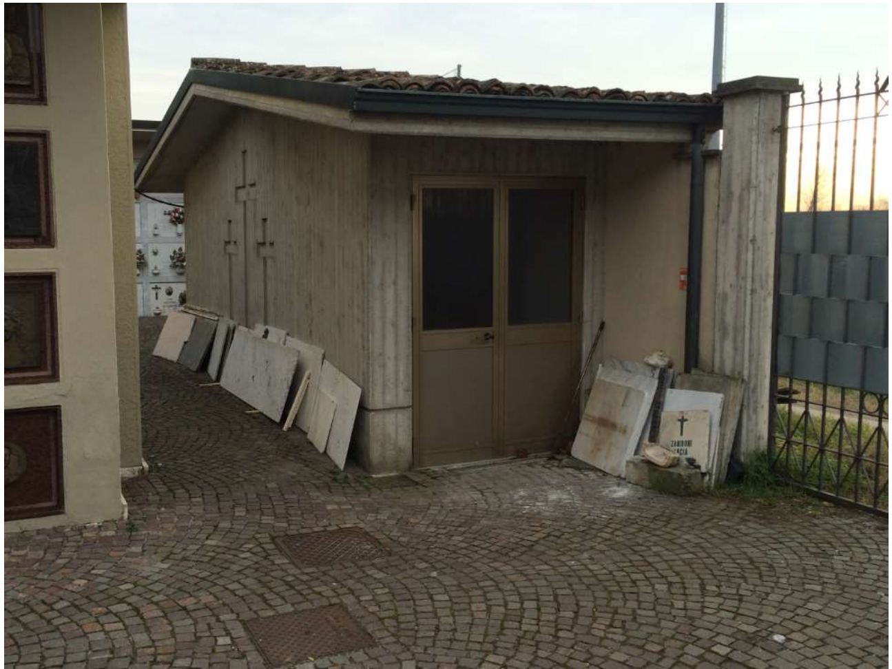
fig.22 – Magazzino