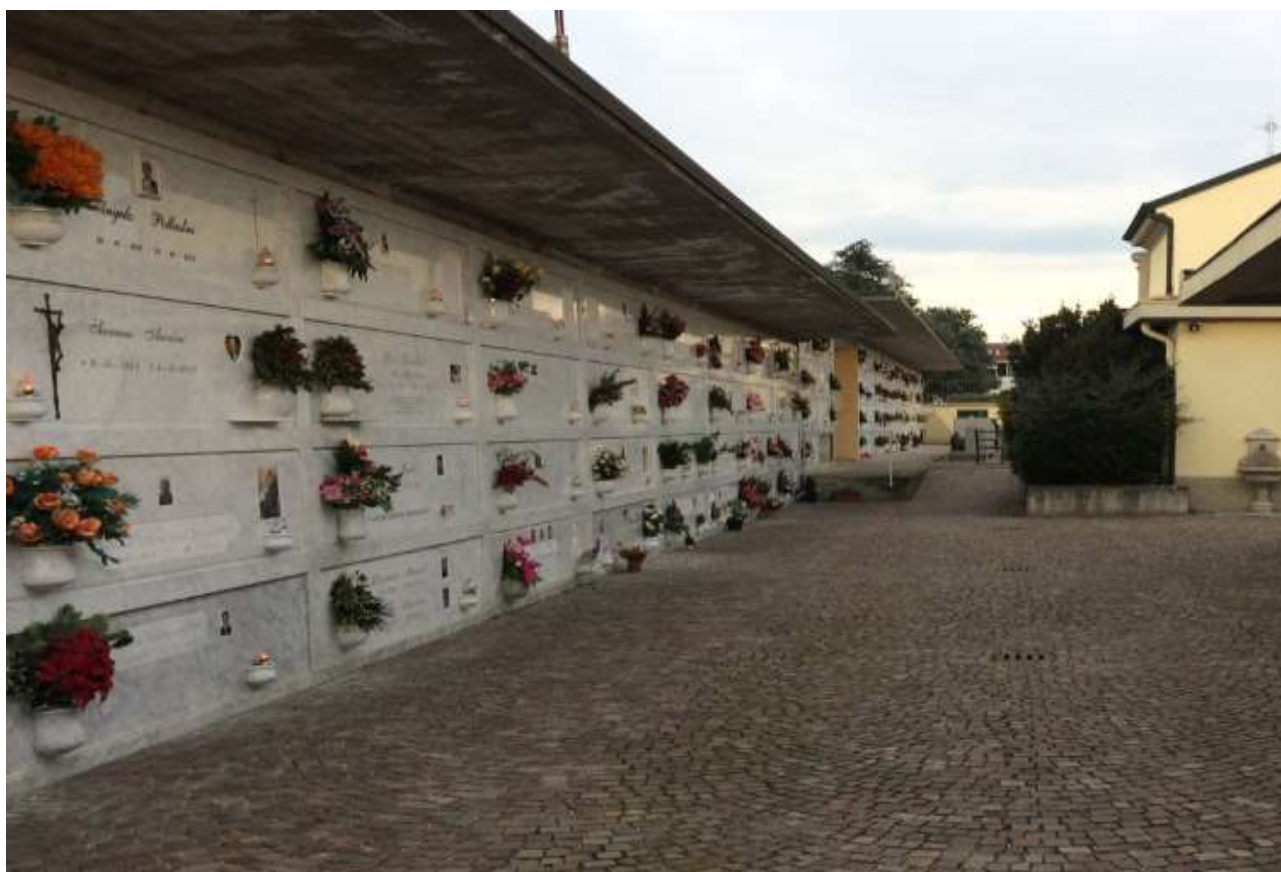
fig.12 – Fronte ovest