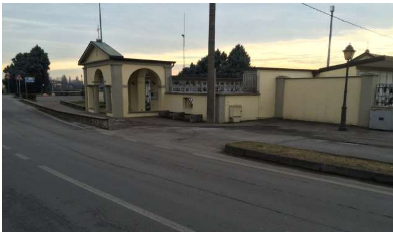
fig.4 – Vista del cimitero da Via De Gasperi