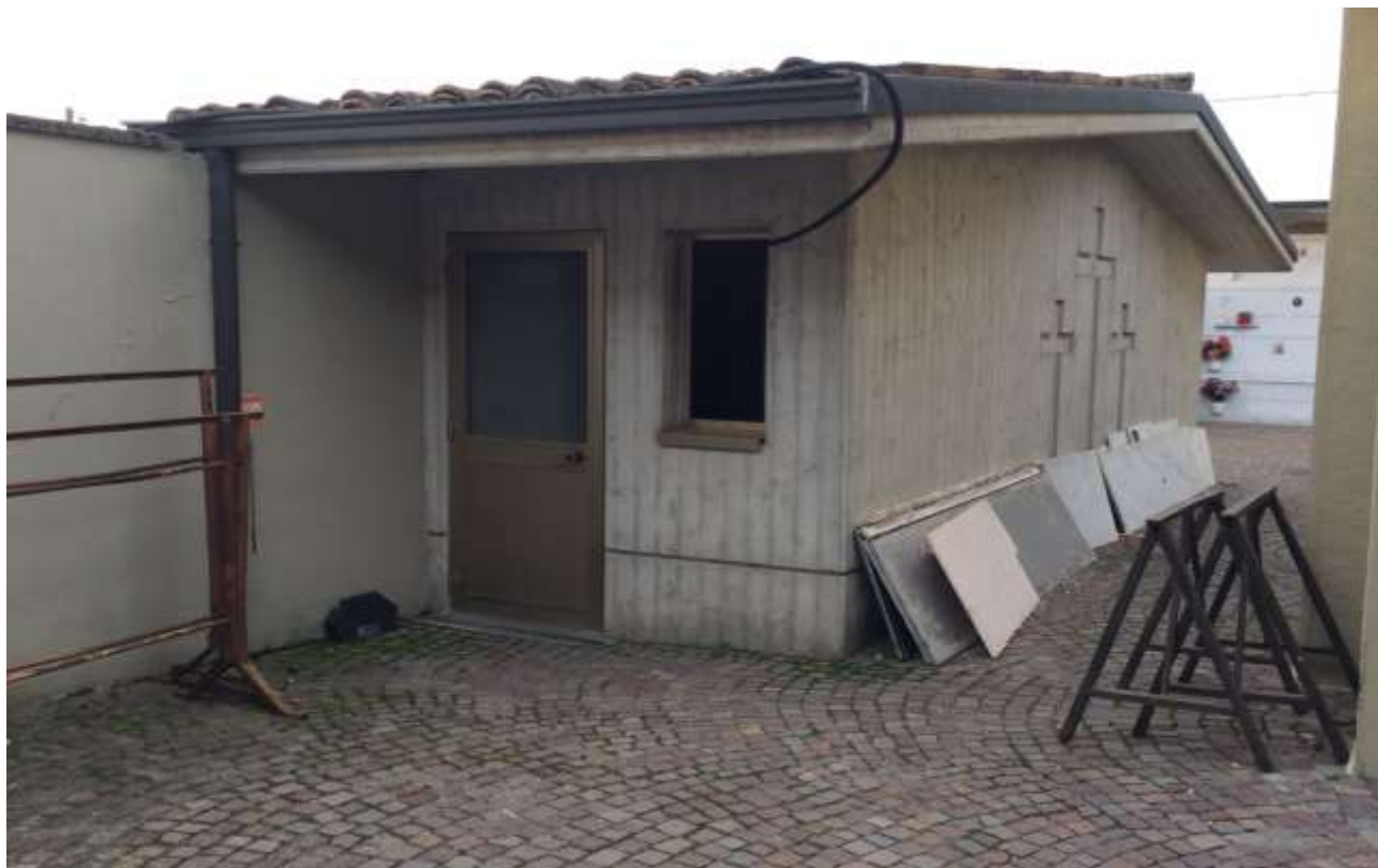
fig.23 – Servizio igienico per il personale