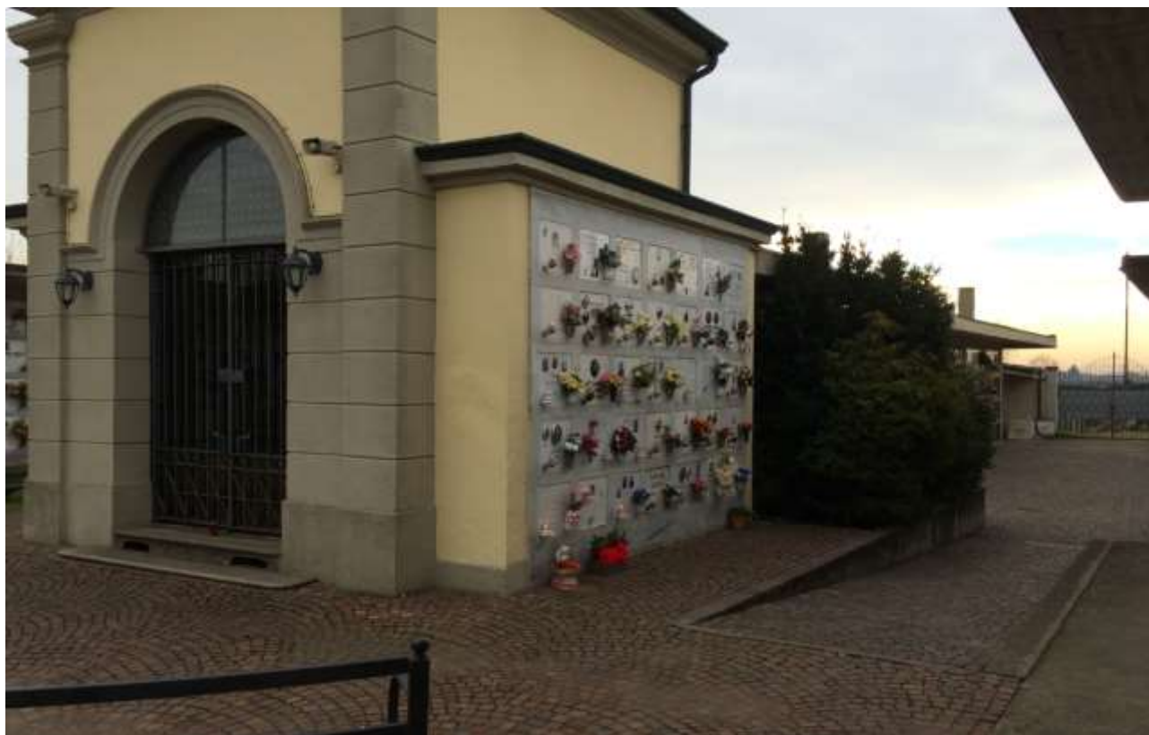
fig. 14 – Cappella centrale