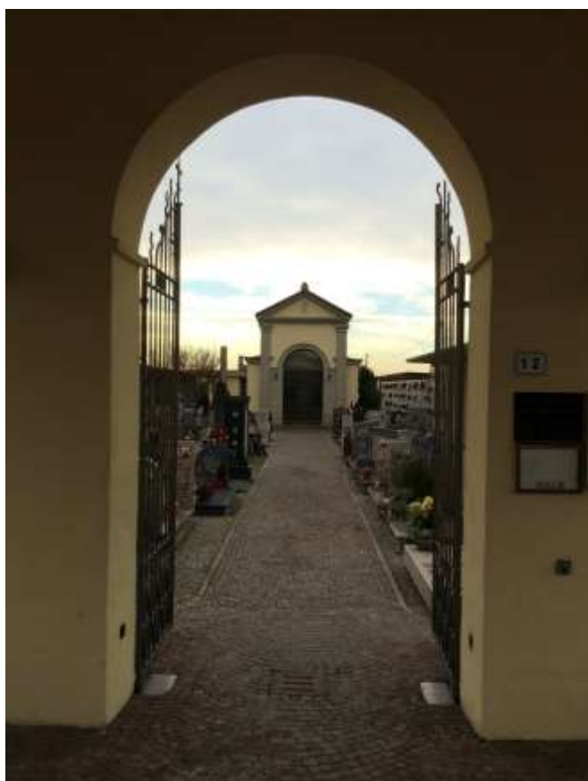
fig.6 – Entrata pedonale