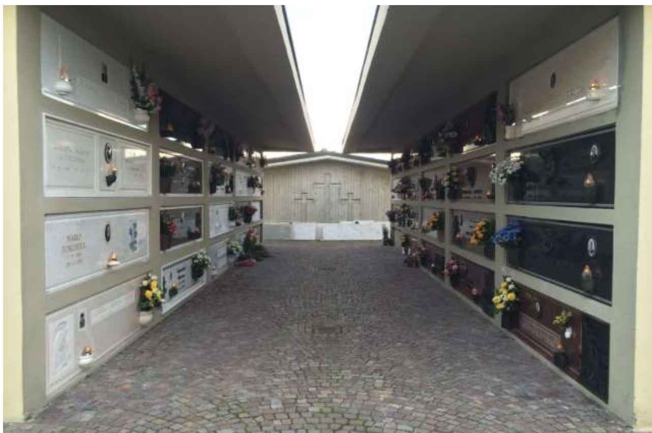
fig.16 – Blocchi sud