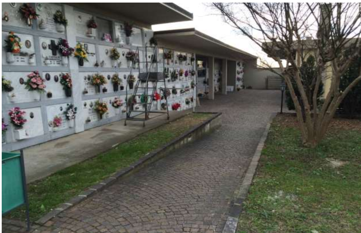
fig.10 – Fronte est