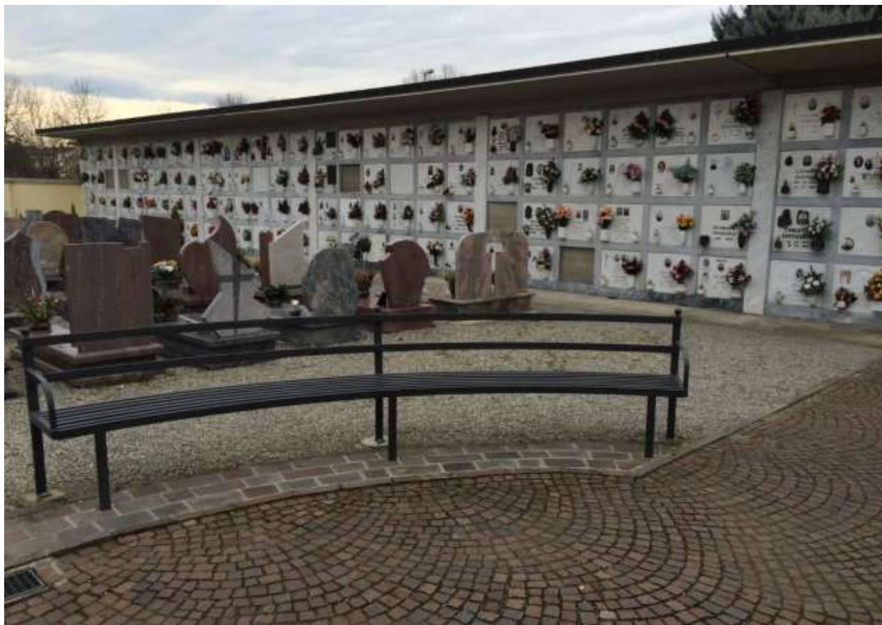
fig.9 – Fronte est