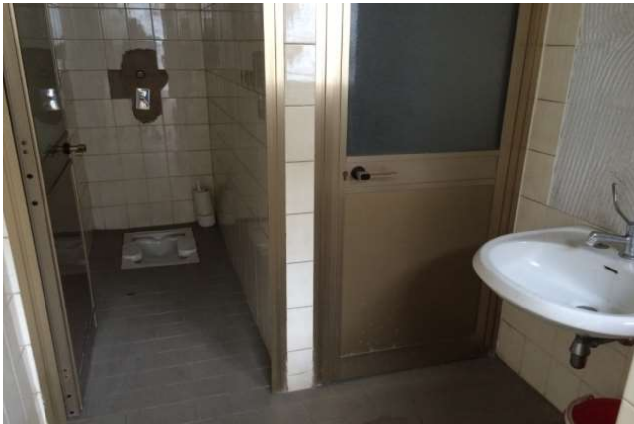
fig.24 – Servizio igienico, antibagno e locale spogliatoio per il personale