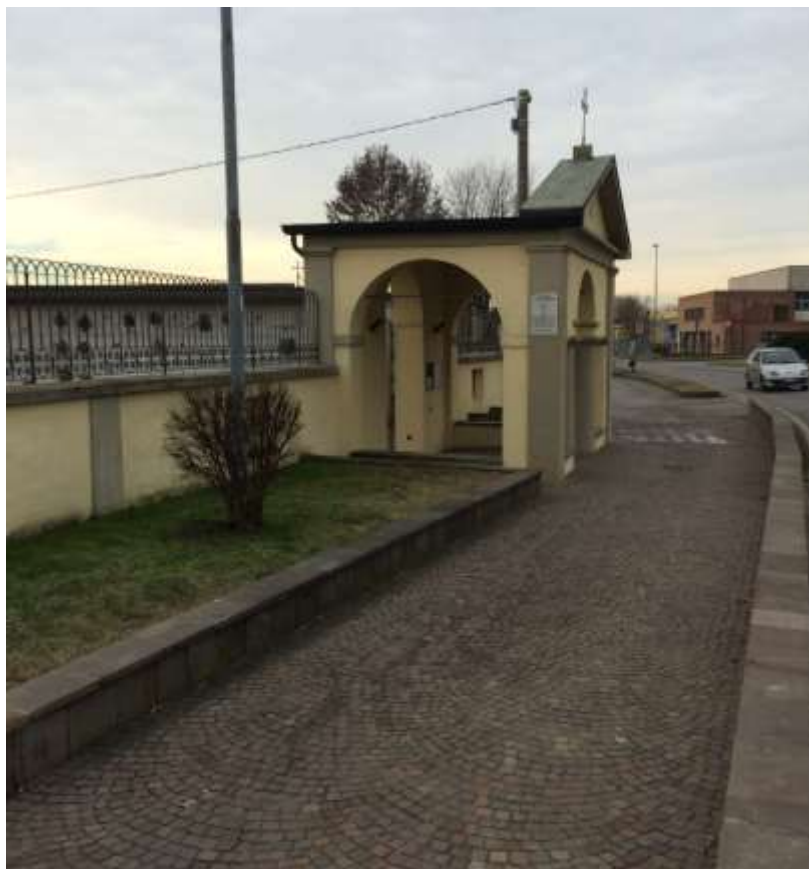
fig.3 – Vista del cimitero da Via De Gasperi