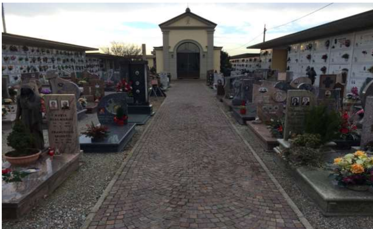
fig.7 – Vista del campo dall'entrata pedonale