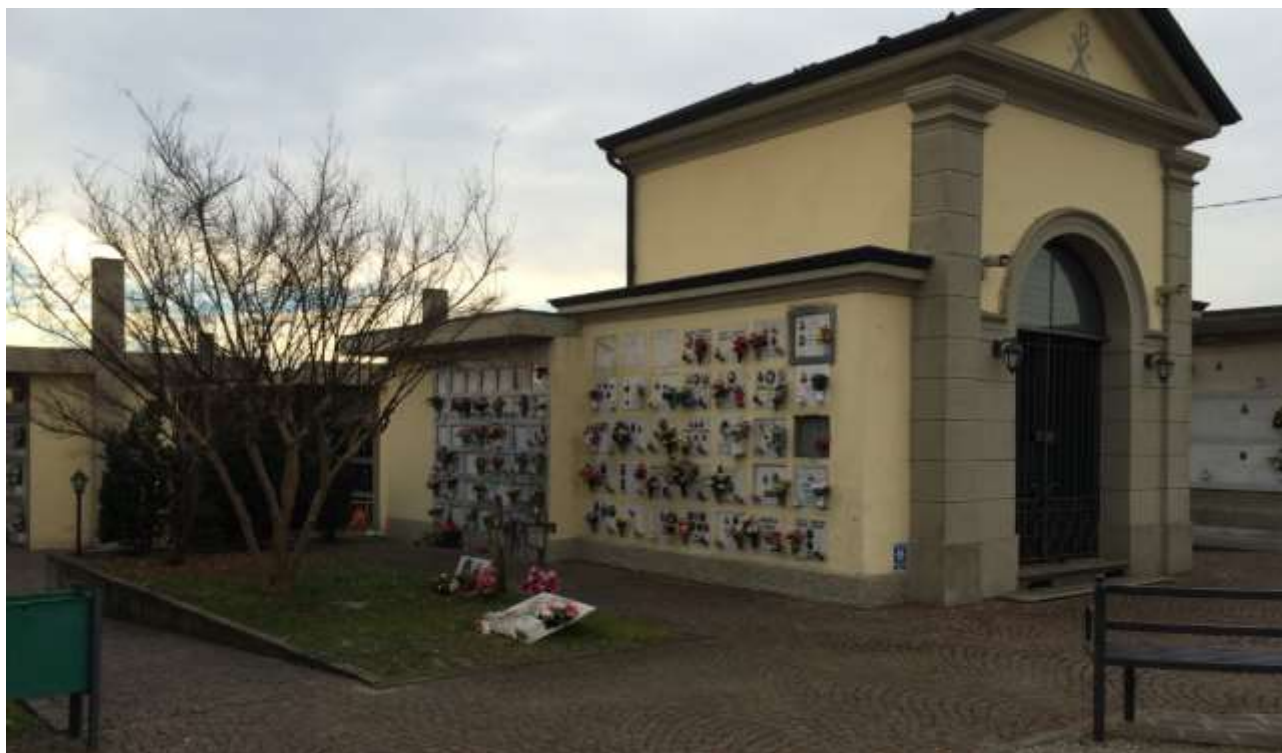
fig. 13 – Cappella centrale