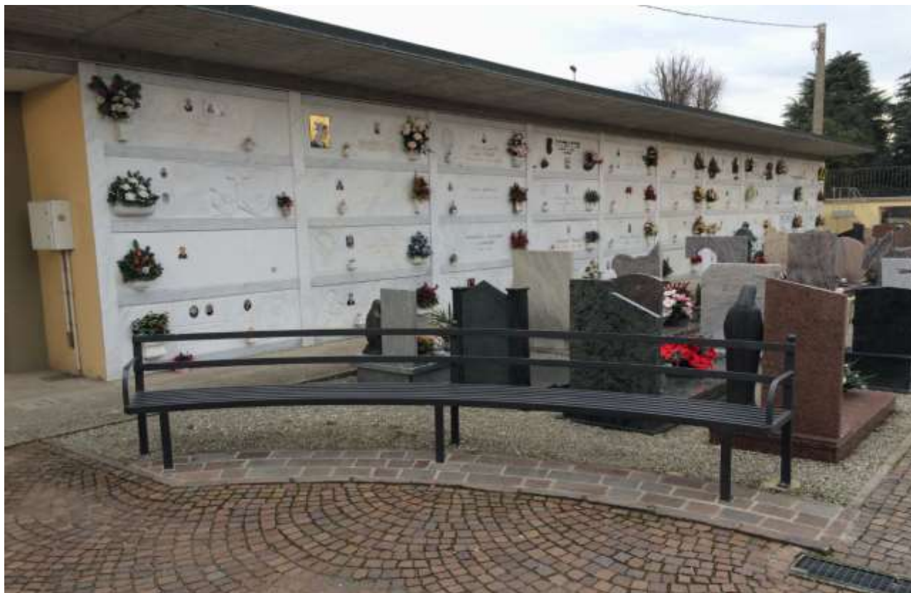
fig.11 – Fronte ovest