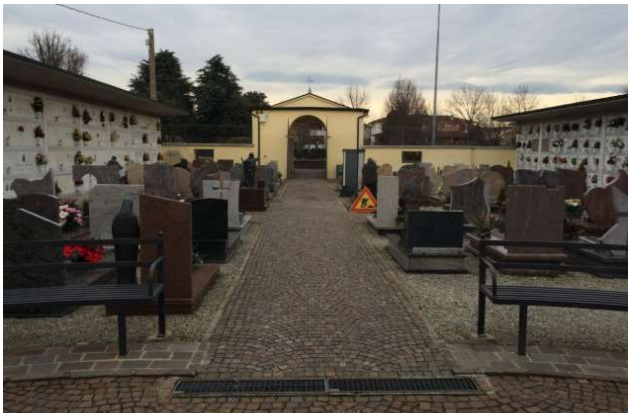
fig.8 – Vista del campo verso l'entrata pedonale