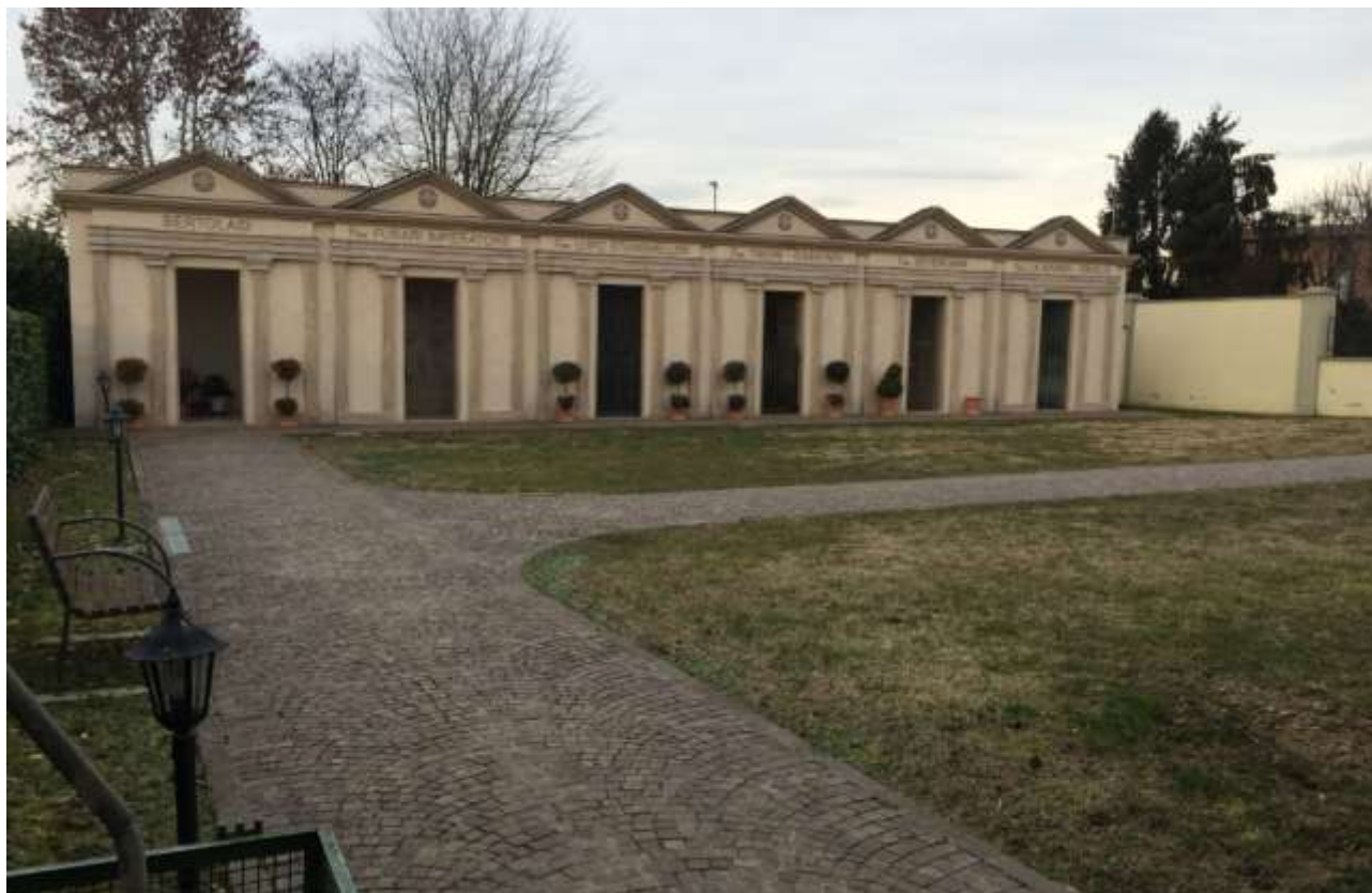
fig.20 – Campo ovest – cappelle gentilizie