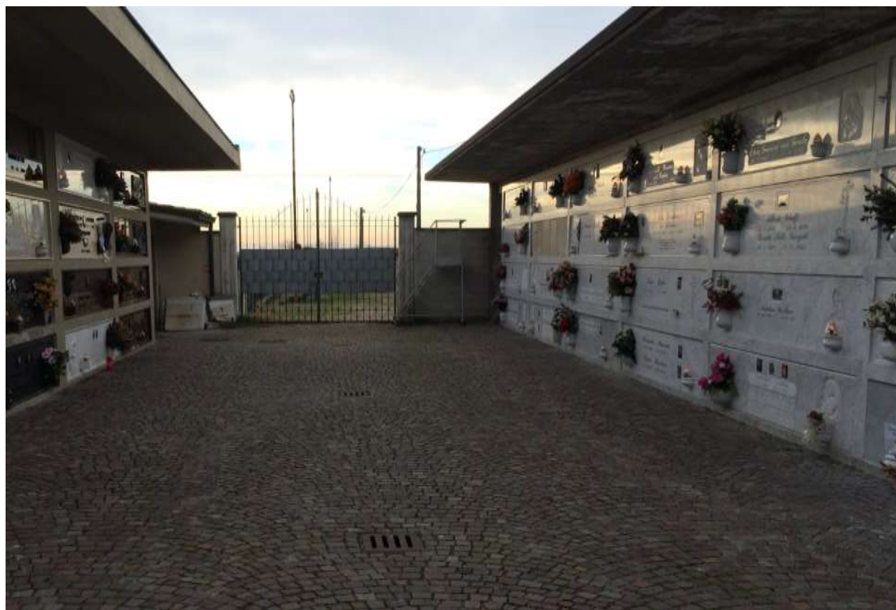
fig.17 – Blocchi sud