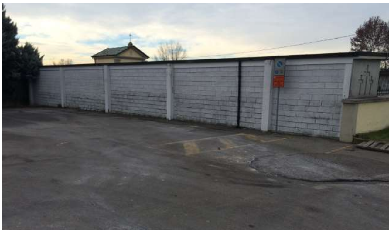
fig.5 – Vista dall'area parcheggio con accesso da Via De Gasperi