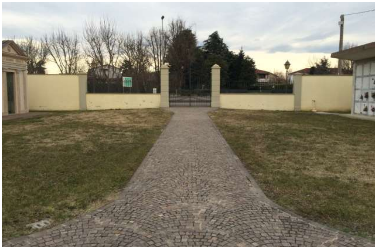
fig.19 – Vista del campo ovest