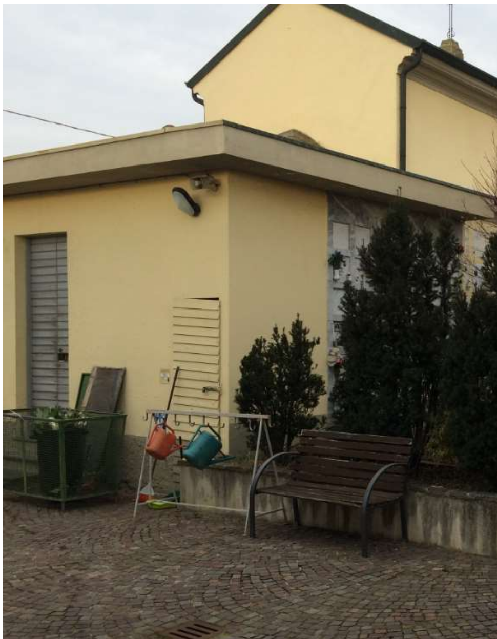
fig.21 – Camera mortuaria