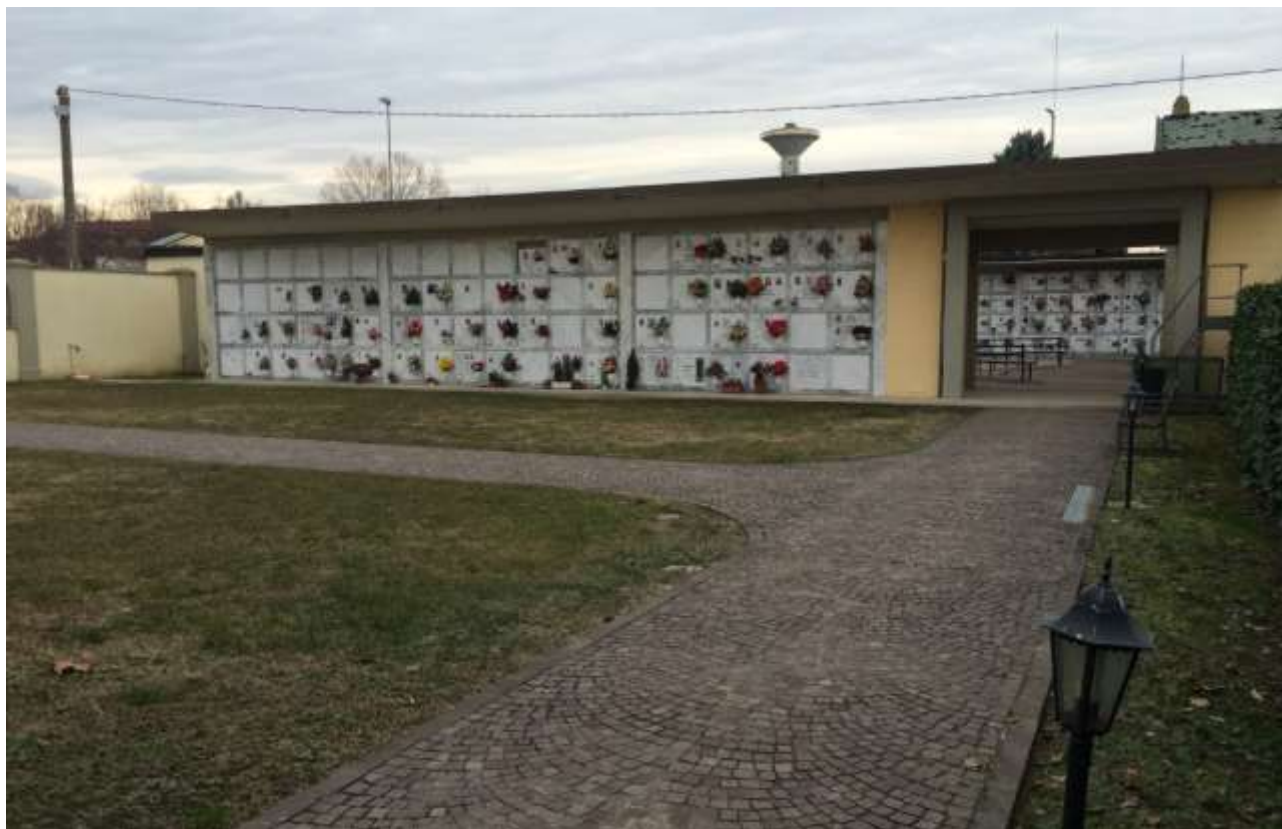
fig.18 – Vista del campo ovest