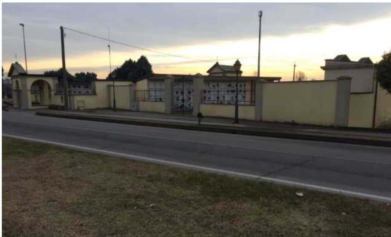
fig.2 – Vista del cimitero da Via De Gasperi