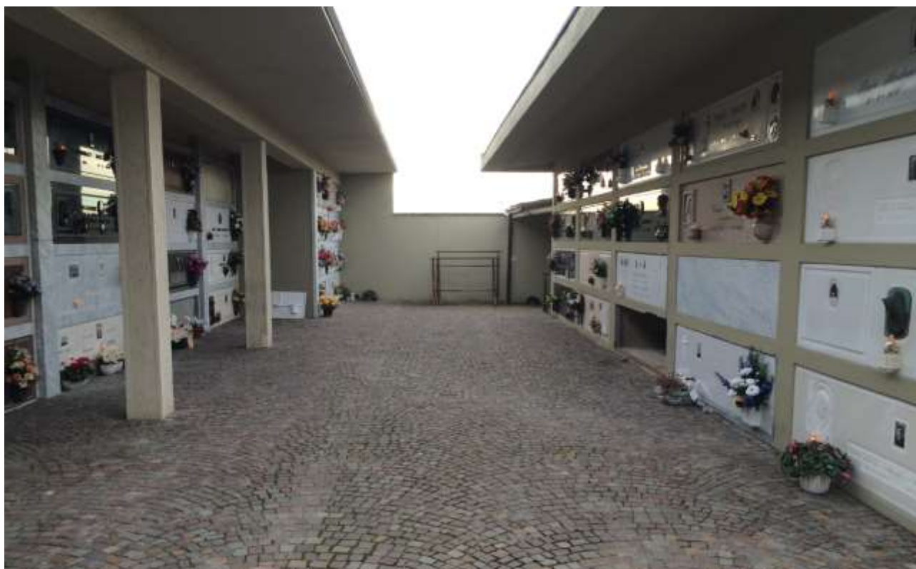
fig.15 – Blocchi sud